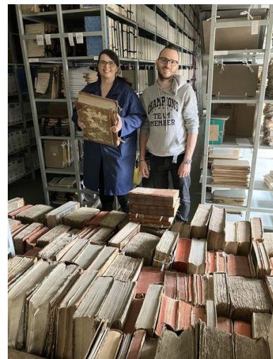
Triedenie dokumentov, ktoré zasiahla hasiaca voda.