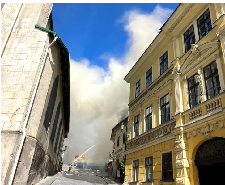
Situácia na začiatku požiaru, 18. marca 2023, okolo 10. hodiny.

Medzitým prišli na pracovisko aj ďalší zamestnanci archívu, ktorí začali spolu s vedúcim preventívne presúvať tie najdôležitejšie archívne dokumenty do menej ohrozenej časti budovy. V bezprostrednom ohrození sa ocitol aj najcennejší materiál, ktorý SBA spravuje, a to archívny fond Hlavný komorskogrófsky úrad v Banskej Štiavnici z rokov 1524 – 1919. Jeho banské mapy a plány sú od roku 2007 zapísané do prestížneho globálneho registra UNESCO – Pamäť sveta.