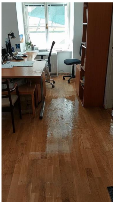
Kancelária na druhom poschodí budovy archívu vytopená hasiacou vodou.

Súhrou priaznivých okolností, ale hlavne vďaka kvalitnej preventívnej príprave budovy v podobe nedávnych revízií hydrantov, hasiacich prístrojov a nového elektronického požiarného systému